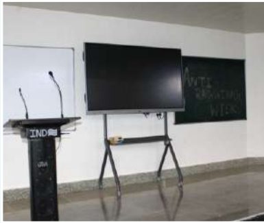
Smart Lecture Theatre with recording